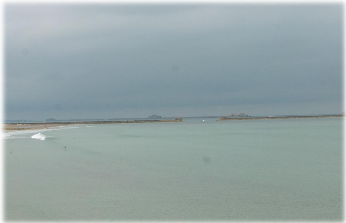
Heel in de verte kunnen we al de vroegere binnenhaven van Cherbourg zien. Het is een lange dijk, de Grande Rade, waar tevens nog drie oude forten staan.