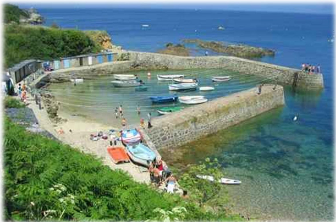
Port de Racine is genoemd naar een van de laatste piraten die ten tijde van Napoleon de zeeën onveilig maakte, kapitein François-Médard Racine (1774-1817).