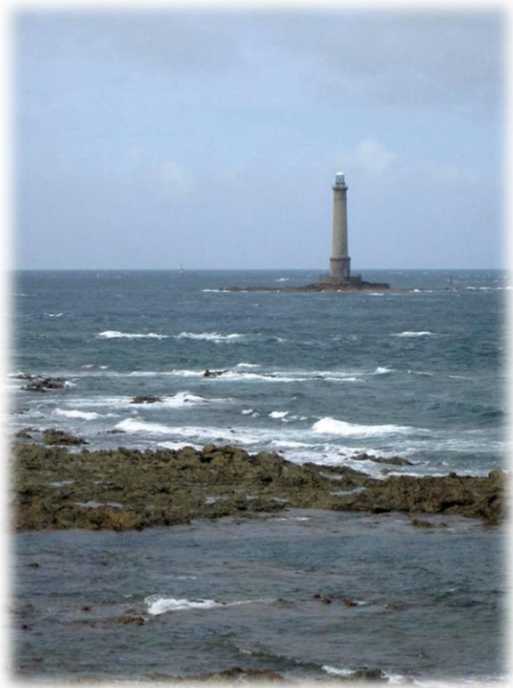
Onderweg komen we regelmatig borden tegen met informatie over het pad. Hier laat men onder andere een schilderij zien van Claude Monnet, die het vanop deze plaats zou geschilderd hebben.